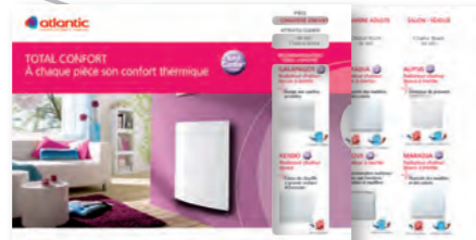
Règlette de choix TOTAL CONFORT