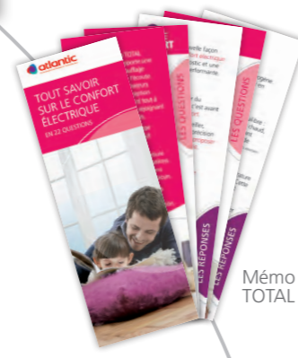
Mémo TOTAL CONFORT

Pour les professionnels, retrouvez-nous sur www.atlantic-pros.fr Pour les particuliers, retrouvez-nous sur www.atlantic.fr