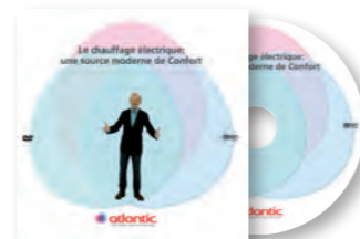
DVD de présentation TOTAL CONFORT